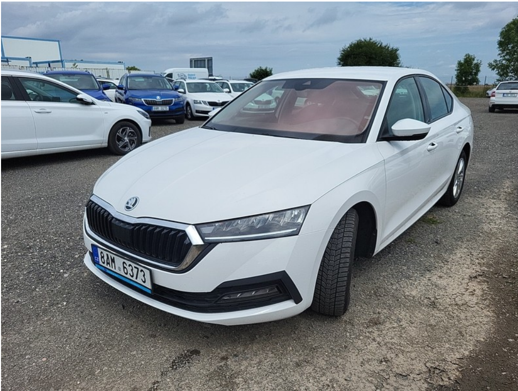
Pohled zepředu zleva