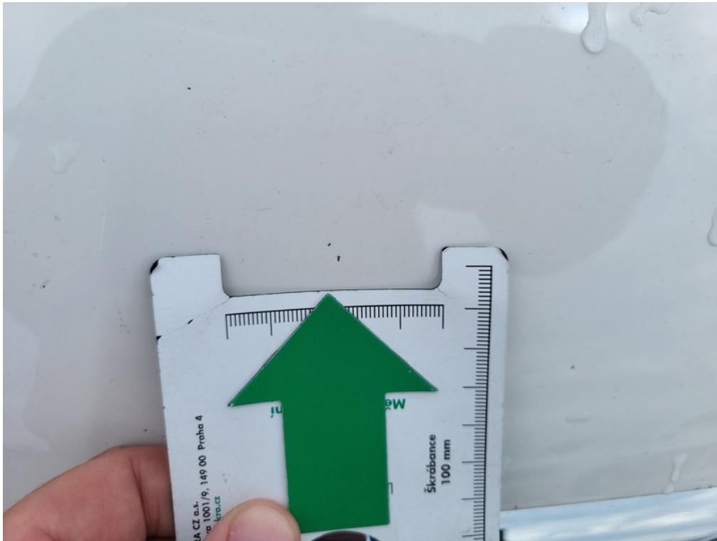
Viz popis k poškození č. 6