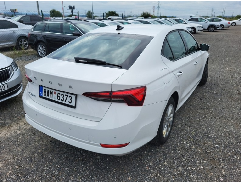
Pohled zezadu zprava