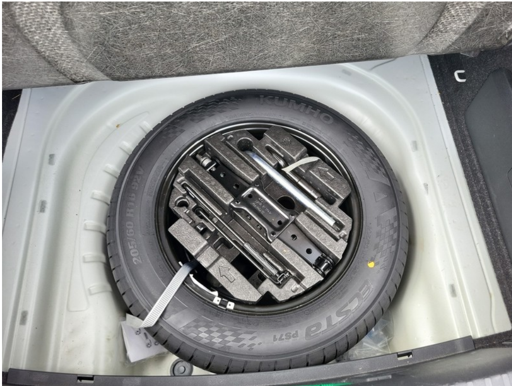
Rezervní kolo / sada na opravu