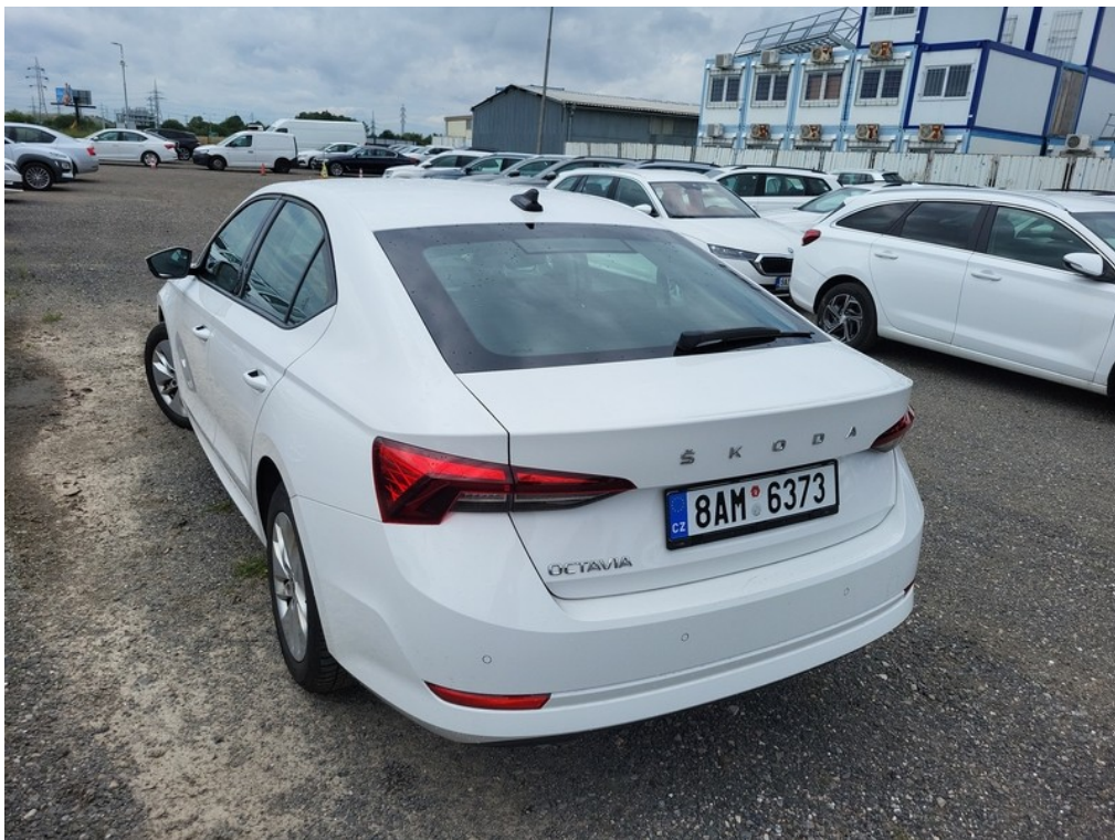
Pohled zezadu zleva