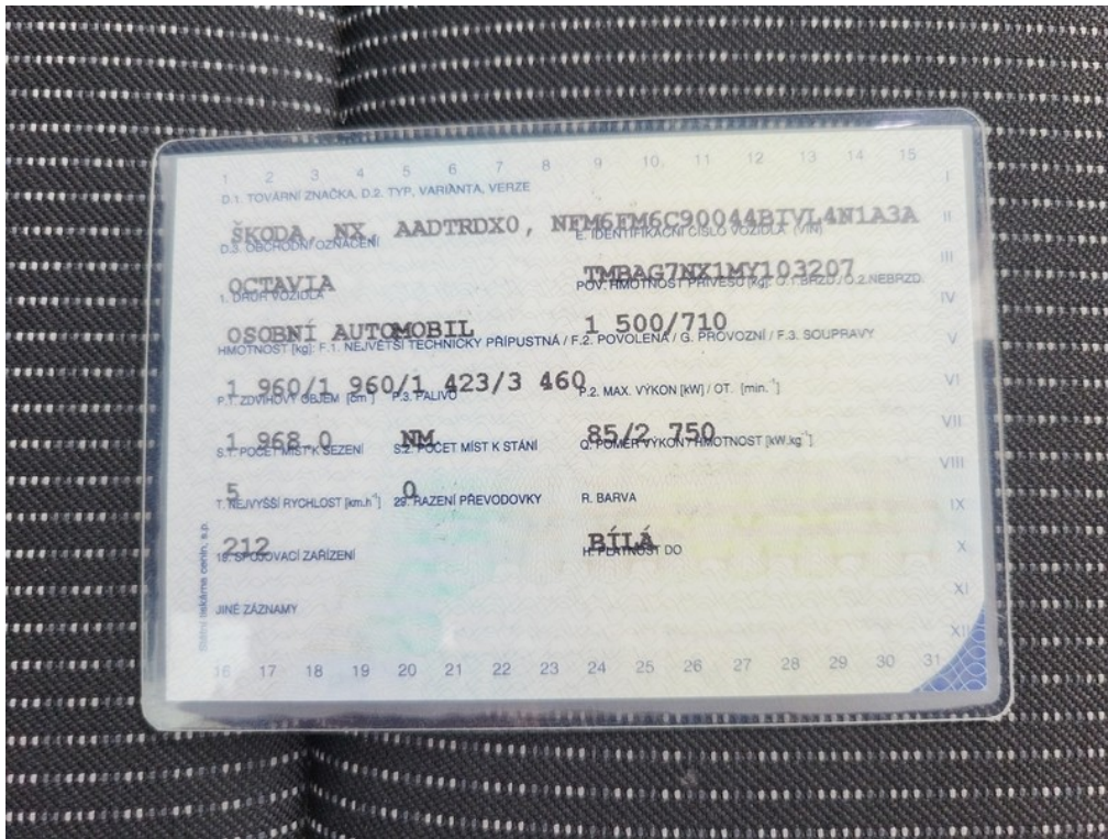
ORV č.l. str.2