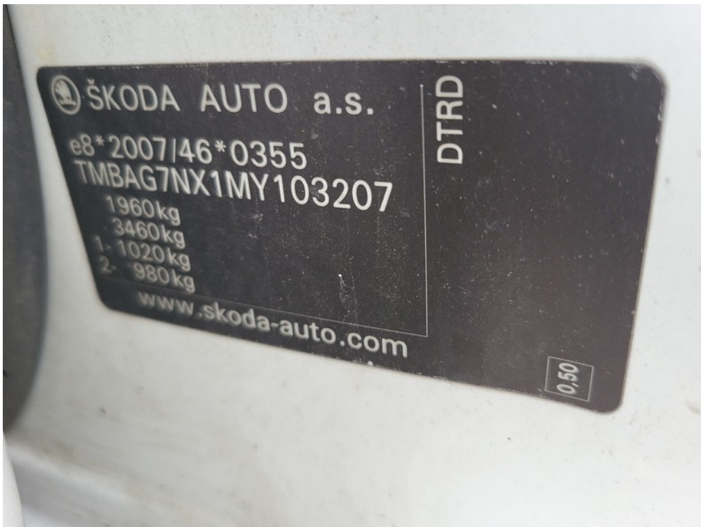
VIN / výrobní štítek