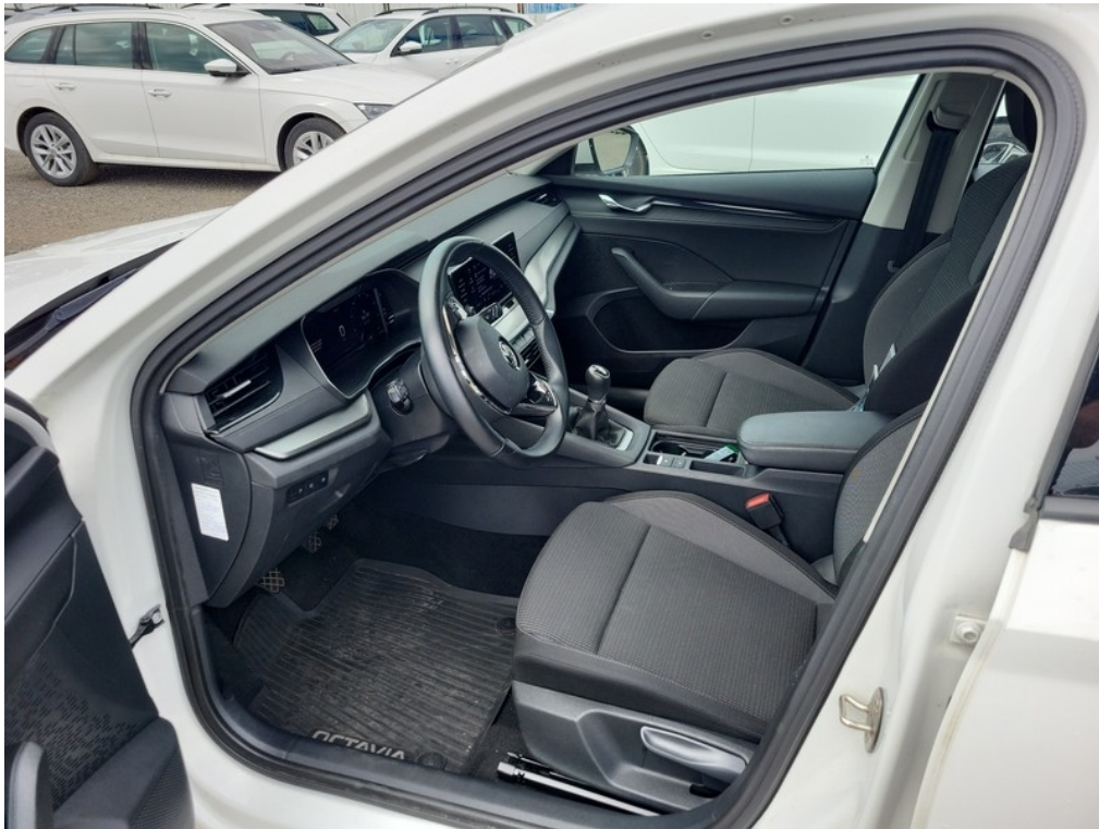
Interiér z levé strany