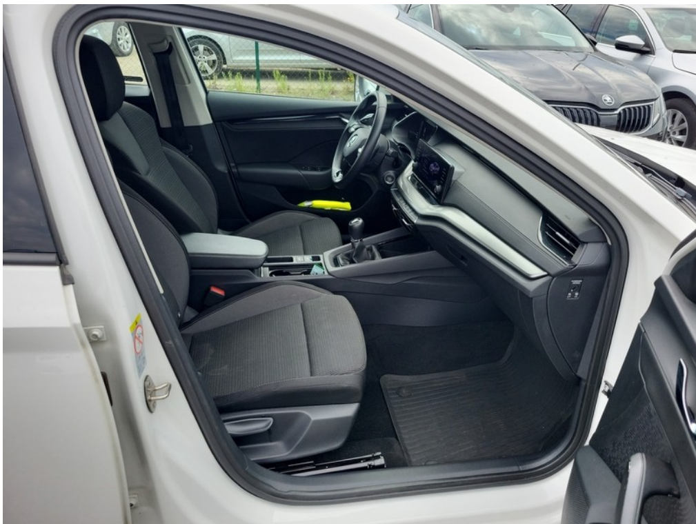
Interiér z pravé strany