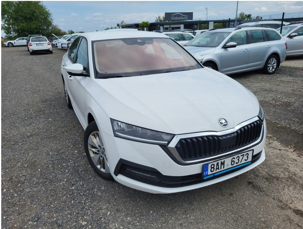
Pohled zepředu zprava