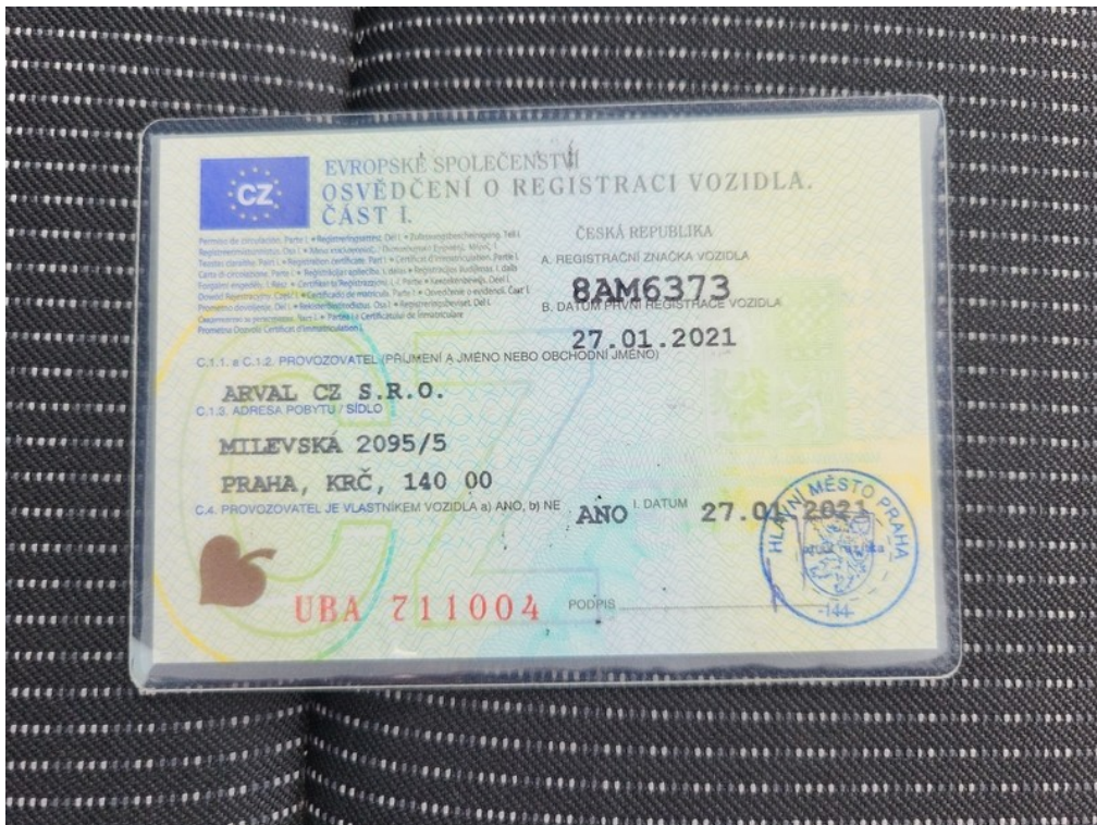
ORV č.I. str.1